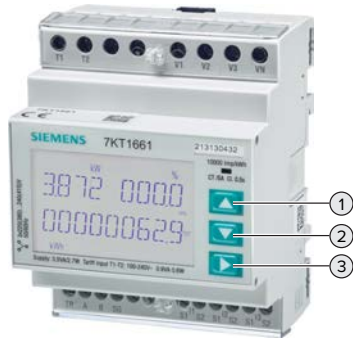
Abb. 3: Menü

Um die Kommunikation zwischen dem Energiezähler und der Ladestation herzustellen, müssen einige Einstellungen im Energiezähler vorgenommen werden.