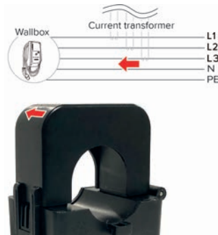
Abb. 2: Einbaulage

Abhängig von der Position der Stromwandler, werden nur externe Verbraucher oder der Gesamtverbrauch (Ladestation und externe Verbraucher) berücksichtigt.