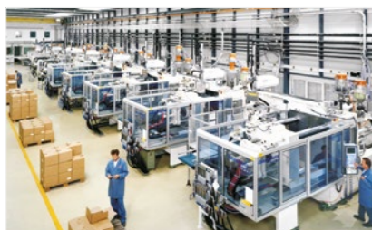
Abbildung: Krauss Maffei Maschinenpark

Wir entwickeln in enger Kooperation mit unseren Kunden und Partnern seit mehr als 45 Jahren Spezialschmierstoffe und Wartungsprodukte für die Bereiche Kunststoffspritzguss und Werkzeugbau.